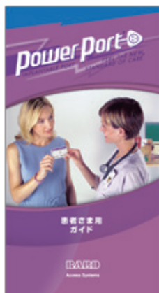
患者さま用ガイド