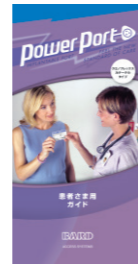
患者さま用ガイド